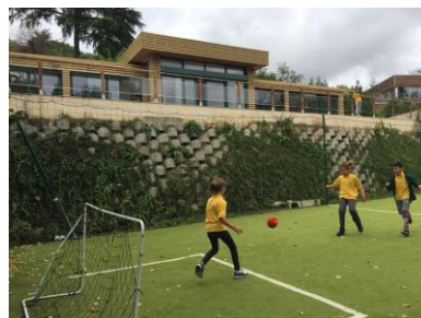
Forest International School Paris