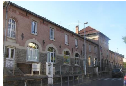
Pôle Associatif Wilson

Locatie Mareil-Marly Forest International School Paris (FISP) 28, rue du Tour d'Echelle 78750 Mareil-Marly