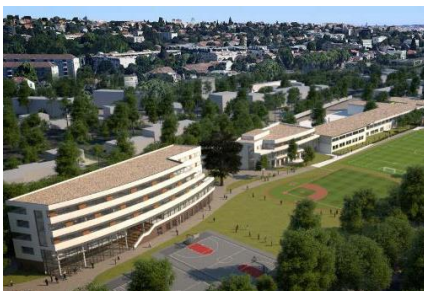
American School Paris